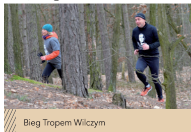
Bieg Tropem Wilczym

Jedleński Szczęp Drużyn Harcerskich i Zuchów „Niezłomni” (ZHR) i odbył