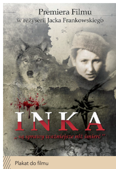
Plakat do filmu