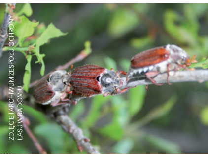
Chrabąszcze ( Melolontha sp.)