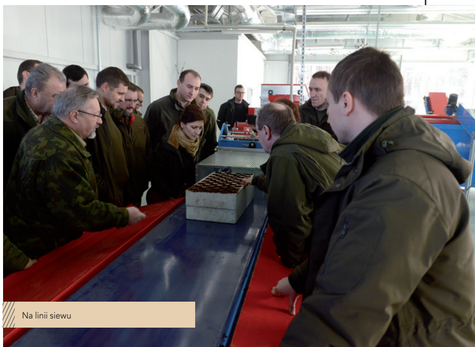
Na linii siewu