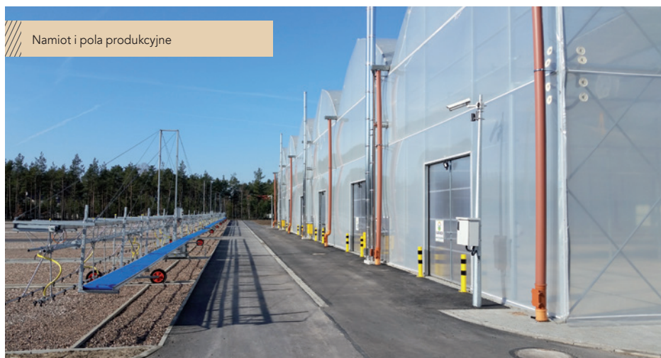
Namiot i pola produkcyjne

Inne z obejranych obiektów to pola produkcyjne (gdzie sadzonki będą osiągały dojrzałość po opuszczeniu namiotu) oraz przechwalnia sadzonek. Pomieści ok. 2 mln sadzonek, które mogą tu bezpiecznie