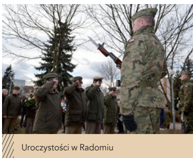
Uroczystości w Radomiu

Jak co roku leśnicy włączyli się w obchody Narodowego Dnia Pamięci Żołnierzy Wyklętych. W uroczystościach w Radomiu wzięli udział leśnicy z biura radomskiej dystrykcji LP oraz nadleśnictw: Kozienice, Marcule, Przysucha, Radom i Zwoleń. Także leśnicy z innych nadleśnictw wzięli udział w obchodach na swoim terenie oraz złożyli hołd Bohaterom.